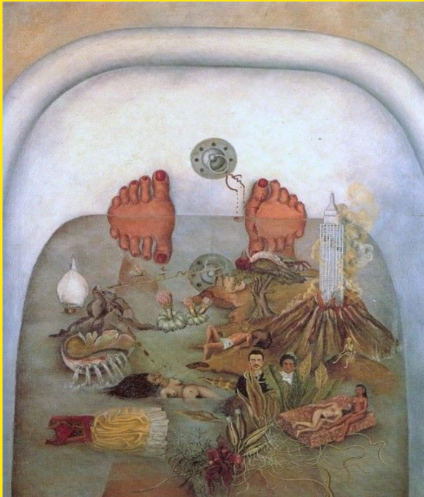
La pintura de Frida Kahlo